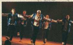
ホール前 がらまんキッズダンス