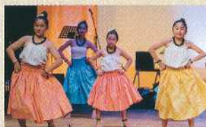
ホール前 がらまんキッズフラ