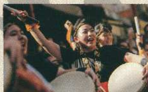
大ホール 惣慶ミジタヤー太鼓