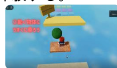
3Dゲーム（ロブックス）